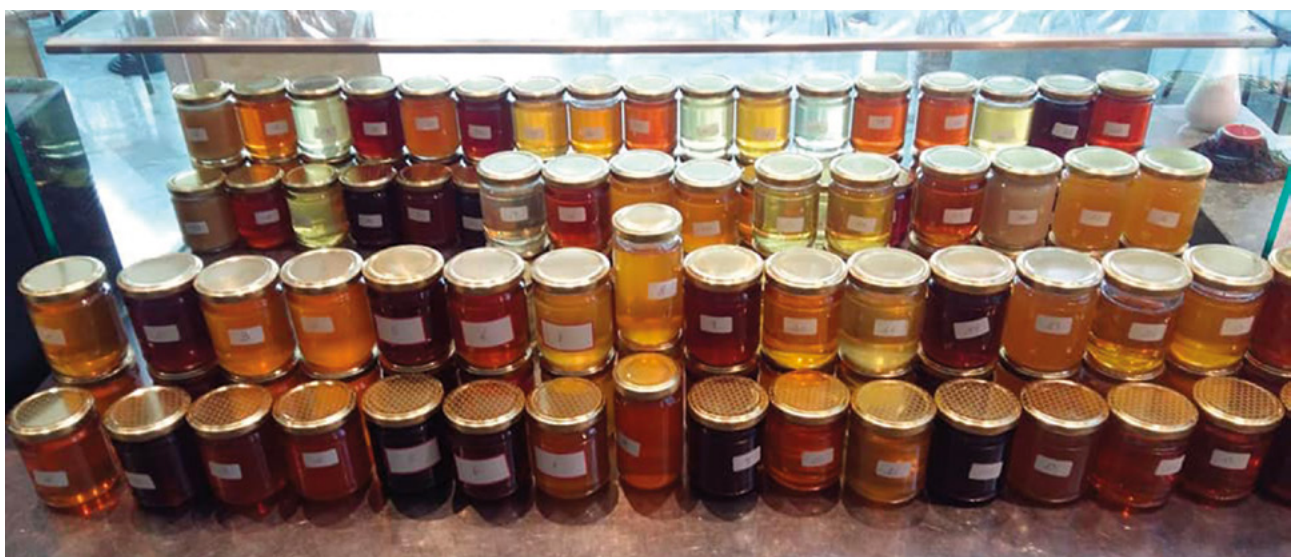
Mieli di Lombardia

"Sull'etichetta deve essere indicato il Paese d'origine in cui il miele è stato raccolto. Se il miele è originario di più Paesi, i Paesi d'origine in cui il miele è stato raccolto sono indicati sull'etichetta nel campo visivo principale, in ordine decrescente rispetto alla loro quota di peso, unitamente alla percentuale rappresentata da ciascuno di tali Paesi di origine. Per ogni singola quota della miscela è ammessa una tolleranza del 5 per cento, calcolata sulla base della documentazione relativa alla tracciabilità dell'operatore. Quando in una miscela il numero