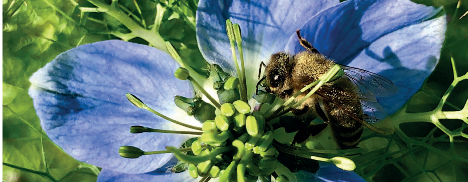
In copertina